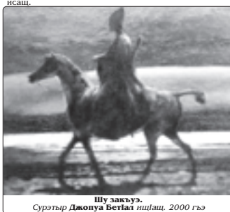
Шу закьуэ. Сурьтыр Джюуэа Бетлаш ишлаш, 2000 гэм