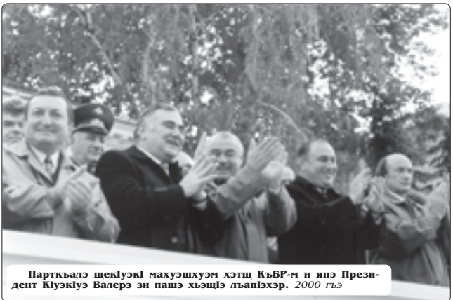
Нартквалэ шеклүэкі махуэшхуэм хэтц КьБФ-м и ялэ Президент Клуэклүэ Валерэ зи пашэ хьэщцэ льялэхэр. 2000 гьэ