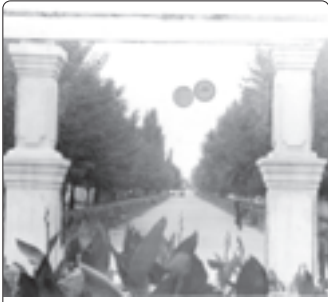
Квалэ парк ихьэлпэр. 1971 гьэ