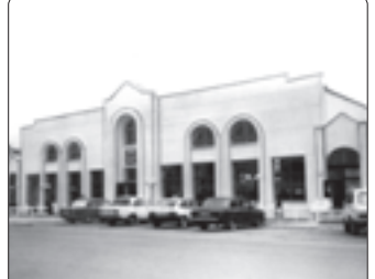
Нартквалэ бээрэм и дыхьэлпэр.