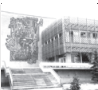
Сату центрыр. 1995 гьэ