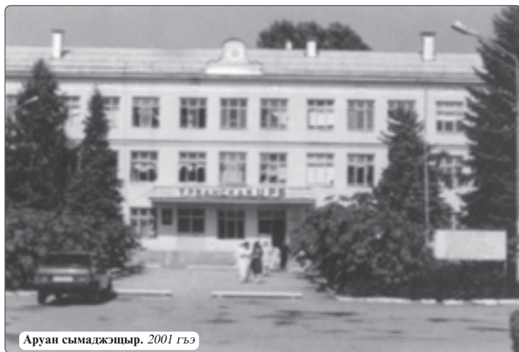
Аруан сымаджэщыр. 2001 гъэ