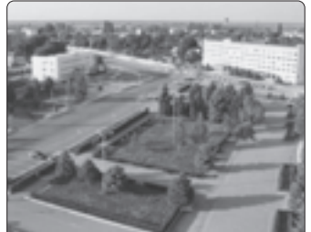
Уэрэм нэхьышхьэм зыкьрех.