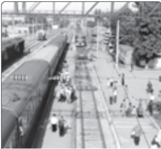
Докшукино гүшц гьуэгу станцыр.