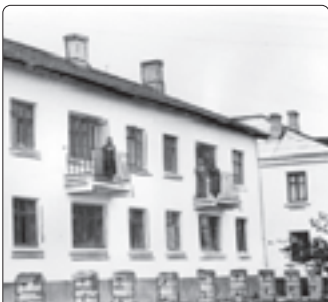
Ялэ унэ зэтэггэр. 1960 гьэ