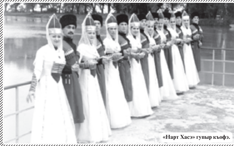
«Нарт Хас» гупыр къофэ.

къыфIашауэ шытащ «Цыхубэ театр» цлэ лъапIэр. Театрым хэт артистхэм я щэныгъэм, зэфIэжым шыхагъахуэ ди республикэм, Москва, Краснодар, Ярославл къалэхэм ищлэ гъуазджэ еджапIэхэм.