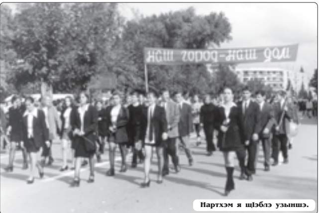
Нартхэм я шцэблэ узьыншэ.