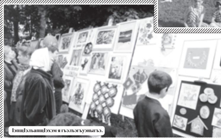
Гэщлэ-лъапщлэхэм я гъэлъэгъуэныгъэ.