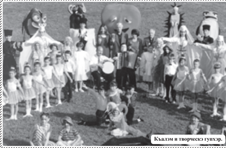
Къалэм и творческэ гупхэр.