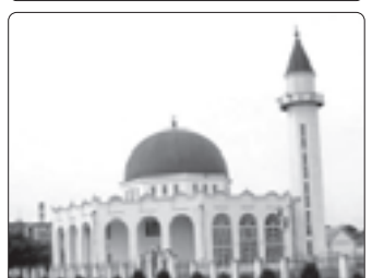
Мэджьытыр - Тхьэм и унэр.