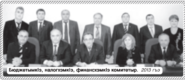
Бюджетымкэ, налохэмкэ, финансхэмкэ комитетур. 2013 гъэ