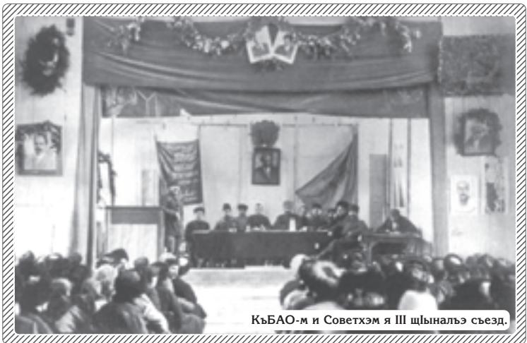
КъБАО-м и Советхэм я III шыналгэ сьезд.

КъБАССР-м и Совет Нэхъы-шхъэр 12-рэ хахаш.