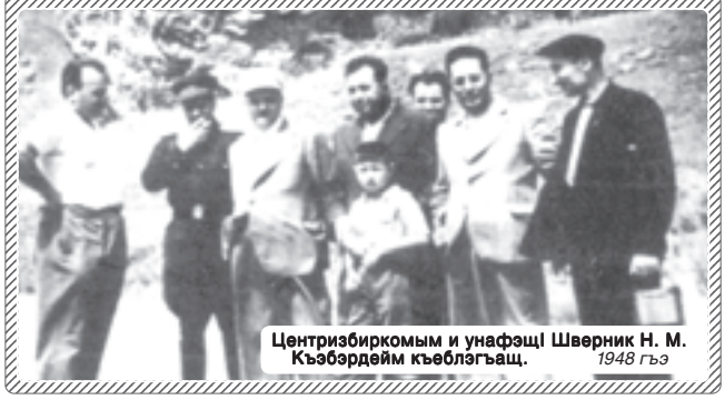
Центризбиркомым и унафэци Шөврий Н. М. Къэбэрдейм къэблэгъащ. 1948 гъэ