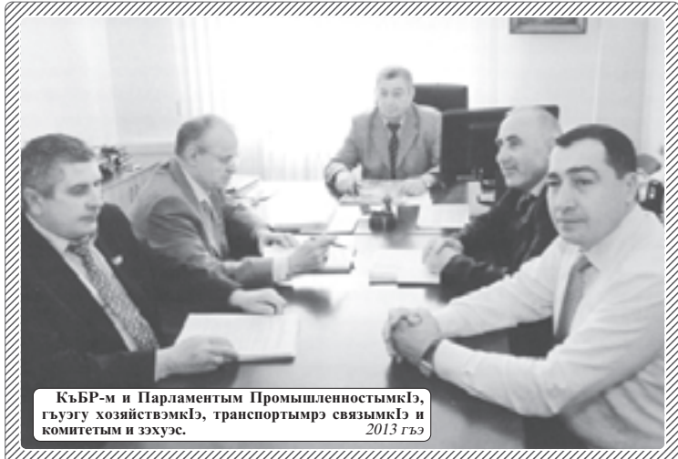
КьБР-м и Парламентым ПромышленностымкIэ, гьуэгуэ хозийствэмкIэ, транспортымрэ связымкIэ и комитетым и зэхуэс. 2013 гьэ

Шалэгьуалэ палатэм и мыхьэнэм и гугьуэ кьыт-хуэшI, Руслан. Ар ноо зэры-лажэ шьIкIэр фигу ири-хьэр? Шалэгьуалэм нэмьшI еджакуэхэри кьыдэжэуэшI-пIэм и лэжыгытэм кьызыр-эфIкырш и шьыхэтцI «Си хэб-зэубзыху жэрдэм» зэнуэр зэревьгэкIуэжыр, апухуэдэ урысейсо зэхьэхуэуэхэм ди