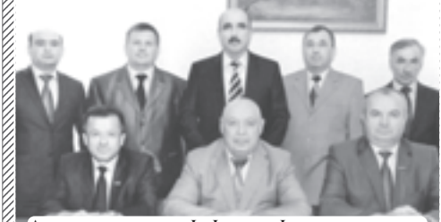
Аграрнэ политикэмрэ шьы луэхуэхэмкцэ комитетым хэтхэр.