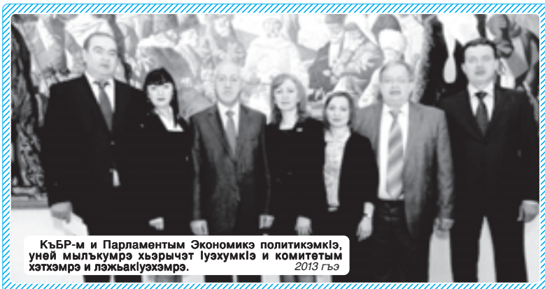
КъБР-м и Парламентым Экономикэ политикэмкэ, уней мылькымрэ хьэрчытэ луэхумкэ и комитетым хэтэхмэрэ и лэжьаклуэхэмэрэ. 2013 гъэ