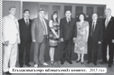
Егъэджынгъэмрэ шьыныгъэмкцэ комитет. 2013 гъэ