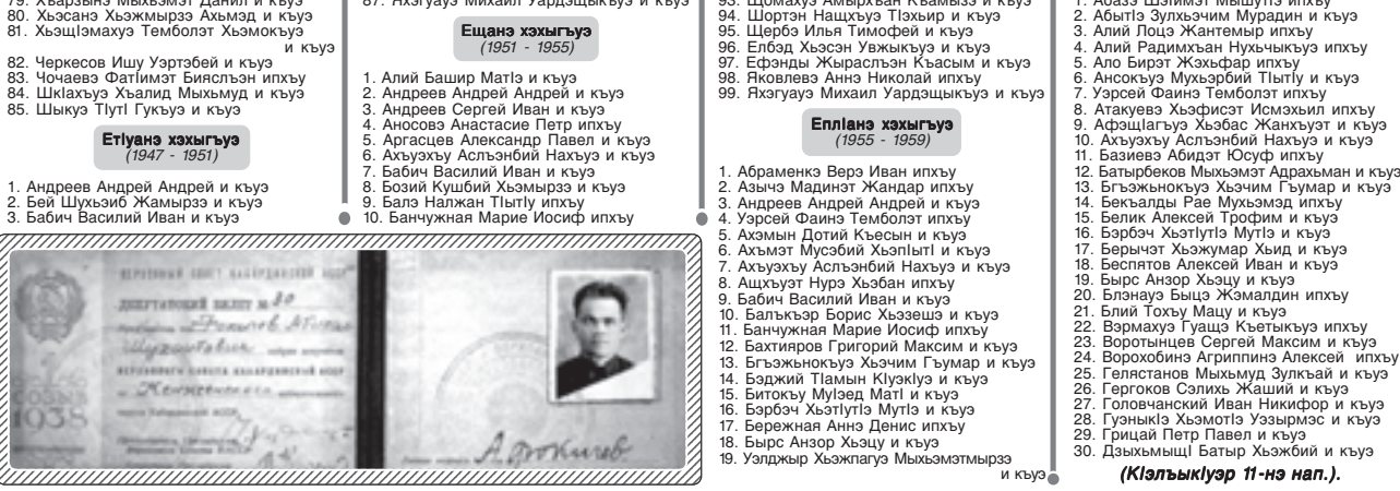
(Къэтыкъуэ 11-нэ нап.)