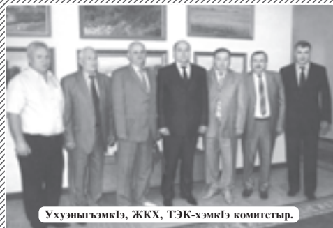
Ухуэныгъэмкцэ, ЖКХ, ТЭК-хэмкцэ комитетыр.