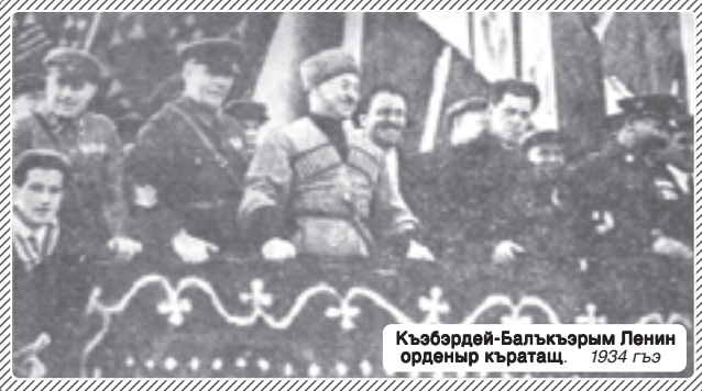
Къэбэрдей-Балъкъэрэм Ленин ордены къратац. 1934 гъэ