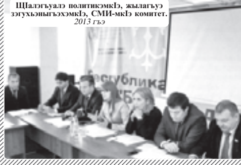
Штлэгъуэлэ политикэмкцэ, жылгъатэ зэгъуылыгъэхэмкцэ, СМИ-мкцэ комитет. 2013 гъэ