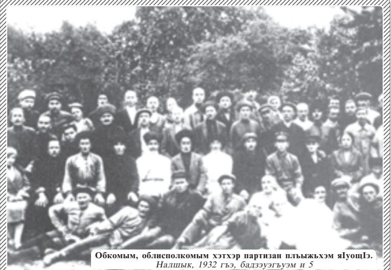
Обкомым, облизполкомым хэтхэр партизан пльыжхэм ялэуэ. Налшык, 1932 гъэ, бадзэуэгъуэм и 5