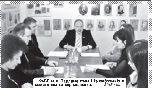
КъБР-м и Парламентым Шхънабзэмкӕ и комитетым хэтхэр мӕлажӕ. 2013 гъэ.