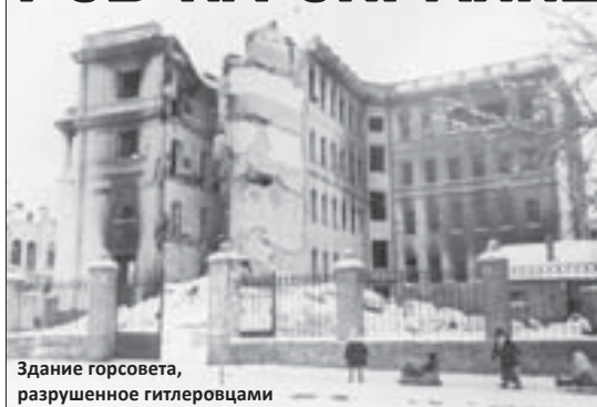
Здание горсовета, разрушенное гитлеровцами

11 января 1943 года в четыре часа утра наступающие части 37-й армии полностью завершили освобождение территории Кабардино-Балкарии от немецких и румынских оккупантов. Шестью днями ранее была освобождена столица нашей республики - город Нальчик.