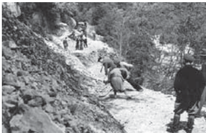
▲ Экспедиция в Хуламо-Безенгийское ущелье, 1959 год. Обвал на дороге близ села Кара-Су. Участники экспедиции вместе с местными жителями расчищают путь

«...Кайсын пригласил к себе домой киргизских писателей и читал всем лермонтовского «Демона», переведенного им на балкарский язык. К сожалению, этот перевод не сохранился. Впоследствии Кайсын рассказывал мне, что после моего отъезда из Фрунзе по наущению «доброжелателей» в его квартире несколько раз производился обыск. Видимо, тогда и исчез тот перевод. Так, пробыв во Фрунзе трое суток,