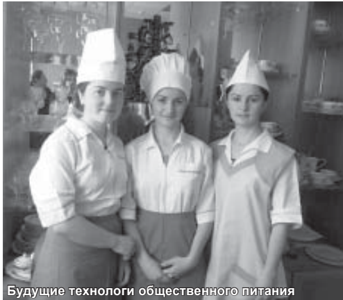
Будущие технологи общественного питания