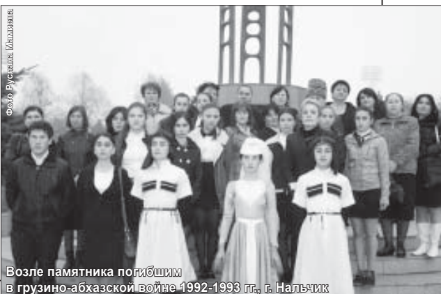
Возле памятника погибшим в грузино-абхазской войне 1992-1993 гг., г. Нальчик