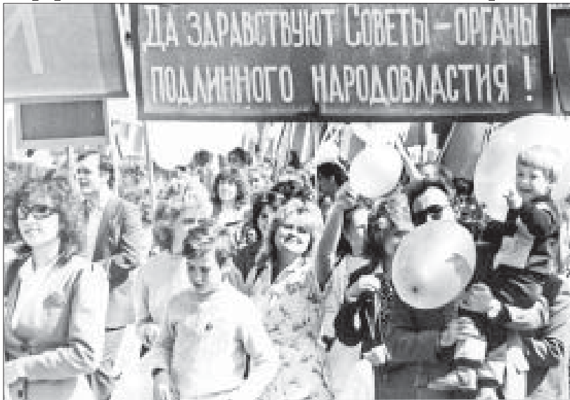
▲ Первомайская демонстрация в Нальчике, 1979 год

руководители КПСС, представители власти, передовики производства, ветераны, почетные граждане. Велась трансляция по местным теле- и радиоканалам. Главная демонстрация страны проходила ежегодно на Красной площади Москвы и транслировалась центральными телеканалами со вставками кадров демонстраций в других крупных городах страны.