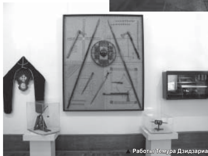
▲ Работы Темура Дзидзария