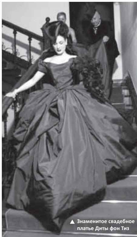
▲ Знаменитое свадебное платье Диты фон Тиз