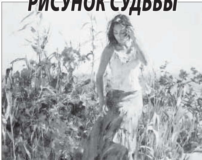
РИСУНОК МЕЧТЫ - РИСУНОК СУДЬБЫ

- Может, вам стоит перестать быть одинокой? Понимаете, состояние человека и даже его судьба определяются во многом тем, чего он хочет. Возможно, у вас нет мужа лишь потому, что не хотите серьезных отношений. Или не верите в них.