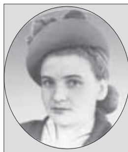
входила в состав Верховного Совета КБАССР десятого созыва.

Великую Отечественную войну 17-летняя комсомолка встретила в Москве. Активно включилась в работу по эвакуации детей, в 40-градусный мороз валила строительный лес на Можайском шоссе, трудилась на военном заводе в энергоцехе, в многотиражной газете «Все для фронта», дежурила в военном госпитале, куда прибывали раненые с фронта красноармейцы.