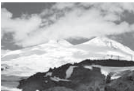
– выбор десяти новых визуальных символов России по