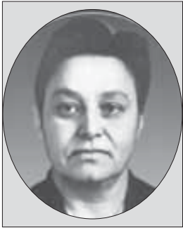
входила в состав Верховного Совета КБАССР шестого созыва.