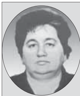
входила в состав Верховного Совета КБАССР десятого и одиннадцатого созывов.

Родилась в селии Старый Черек Урванского района. В начале 50-х годов поступила на инженерно-технический факультет Московского технологического института пищевой промышленности. Вернувшись в Кабардино-Балкарию, была назначена заместителем начальника цеха Нальчикской кондитерской фабрики. Затем ее приглашают в Министерство пищевой промышленности КБАССР на должность начальника производственно-технического отдела.