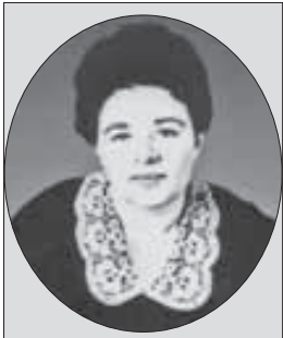
входила в состав Верховного Совета КБАССР девятого созыва.

Родилась в 1937 году в Казахстане. Вернувшись на родину, работала в Бабугенте станочницей механизированного лесного пункта и мечтала стать учительницей. И эта мечта осуществилась. После десятилетки окончила ускоренные педагогические курсы и стала преподавать в школе русский язык. Затем заоч-