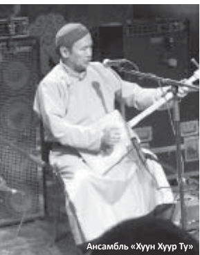
Ансамбль «Хуун Хуур Ту»

Глубинная мощь звука, словно извлекаемого из самых недр земли и вырывающегося наружу, – вот визитная карточка всемирно известного тувинского ансамбля «ХУУН ХУУР ТУ», уже