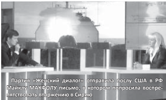
Партия «Женский диалог» отправила послу США в РФ Майклу МАКФОЛУ письмо, в котором попросила воспрепятствовать вторжению в Сирию