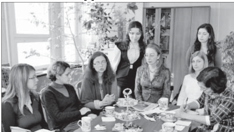
Журналисты ТД «Образ» в редакции «Горянки»

Главный редактор газеты «Горянка», поэт и драматург