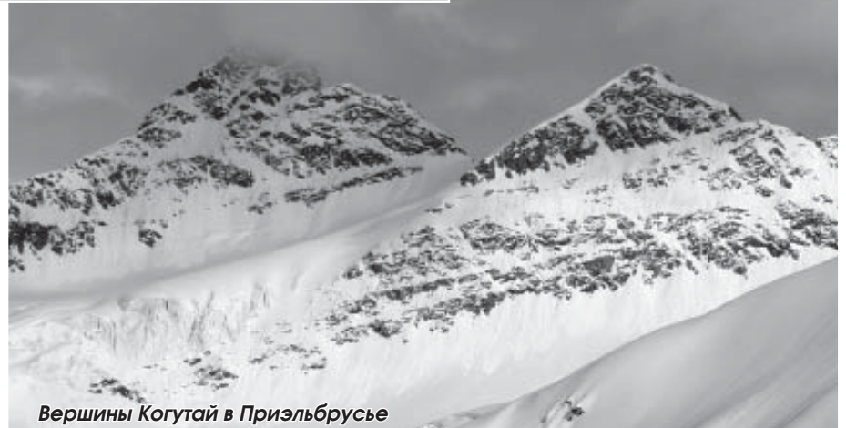
Вершины Когутай в Приэльбрусье