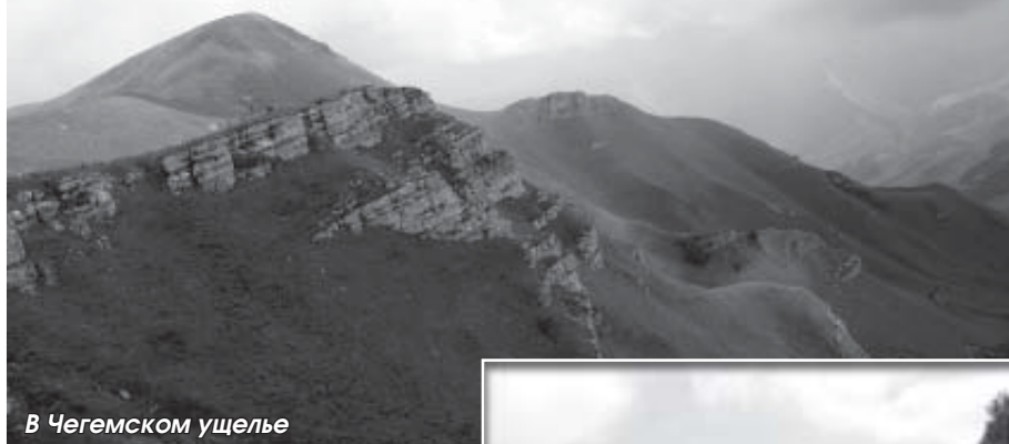
В Чегемском ущелье