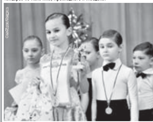
На январь бал выбор не случайно: дети отдаются каникулам, да и родителям пришлось в выходные отлучаться с работы. Кто-то танцевал сольно, а кто-то в паре. Возрастная категория под названием «БЭБи» (пять-семь лет) не оставила никого равнодушным. Мало того, что самая

Многие с удовольствием готовы смотреть на танцующих. А когда это касается балльных танцев, у зрителей дух захватывает от мастерства и грации артистов. В минувшую субботу прошел открытый чемпионат КБР по спортивно-балльным танцам. Его организатор – Республиканский Дворец творчества детей и молодежи собрал около двухсот юных танцоров из Нальчика, Предлагского и Моздокского районов.