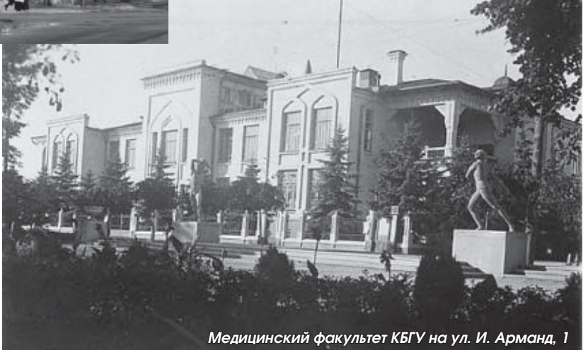
Медицинский факультет КБГУ на ул. И. Арманд, 1