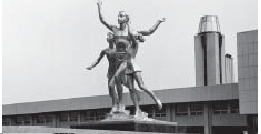
Республиканский центр творчества детей и молодежи на пр. Ленина, 8

Дом пионеров в Нальчике до Великой Отечественной войны находился неподалеку от входа в городской парк, в здании на ул. Инессы Арманд, 1, где изначально, еще в дореволюционное время, располагалась реальное училище (в отличие от классических гимназий в реальных училищах не изучали древние языки – латинский и греческий, а делали упор на