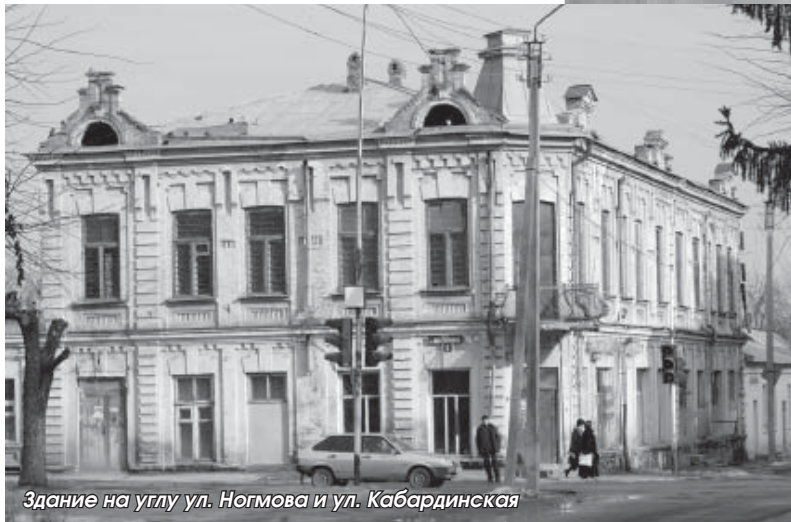
Здание на углу ул. Ногмова и ул. Кабардинская

точные и естественные науки). Помещения с высокими потолками казались жителям Нальчика, преимущественно проживавшим в турлучных (саманных) домиках, пугающе большими. Один из старожилых города вспомнил, как в шестилетнем возрасте из любопытства зашел в Дом пионеров и расплакался, потерявшись в его коридорах.