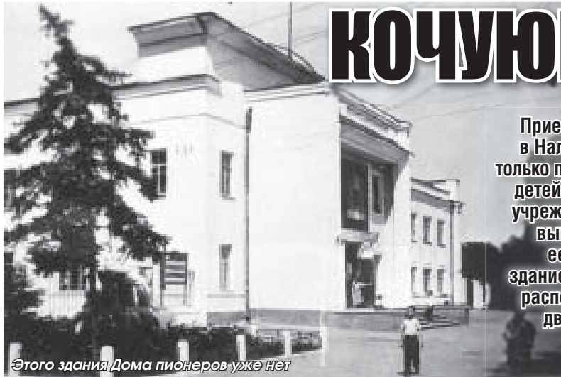
Этого здания Дома пионеров уже нет

Приезжий человек, увидев в начале проспекта Ленина в Нальчике большое серое двухкорпусное сооружение, только по скульптурной композиции с фигурками бегущих детей сможет догадаться, что здесь находится какое-то учреждение для юного поколения. На фасаде нет яркой вывески, а если есть небольшая табличка, то издали ее не видно. По старой памяти горожане называют здание Дворцом пионеров, хотя официальное название расположенного в нем учреждения – Республиканский дворец творчества детей и молодежи Министерства образования и науки КБР. Длинно, сложно, и запоминается с трудом.