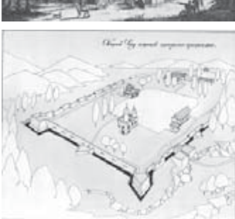
Мы понимаем конечно, что рисунок крепости Нальчик достаточно условен, но как говорится: «Кто может, пусть сделает лучше!»