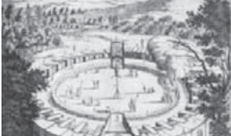
Мы понимаем конечно, что рисунок крепости Нальчик достаточно условен, но как говорится: «Кто может, пусть сделает лучше!»