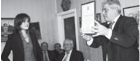
Здесь же были выбраны пять делегатов на X съезд Союза журналистов России, который состоится в этом году в Москве.