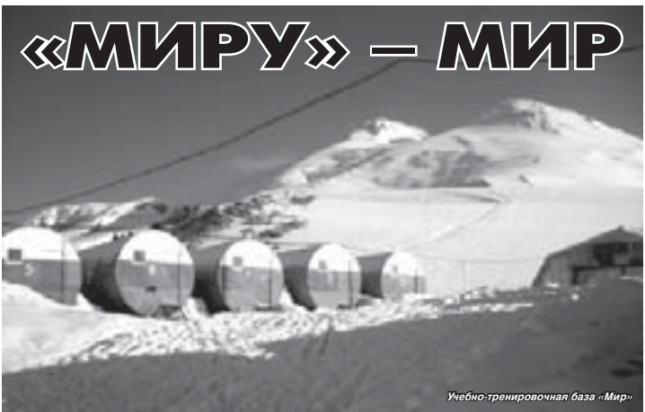
Учебно-тренировочная база «Мир»

(Окончание. Начало на 1-й с.) В «бочке» шесть спальных мест, в ее отсеках можно сушить и хранить вещи, складывать лыжное снаряжение. Два помещения оборудованы под кухню, и можно одновременно накормить до сотни человек. В теплое время года она функционирует практически постоянно. Продукты поднимают с собой альпинисты и туристы, их гиды по канатной дороге или на ратраке. Хранятся они в своеобразных холодильниках – специально встраиваемых в снег пультках. У организаторов групп проблем с питанием практически не возникает.