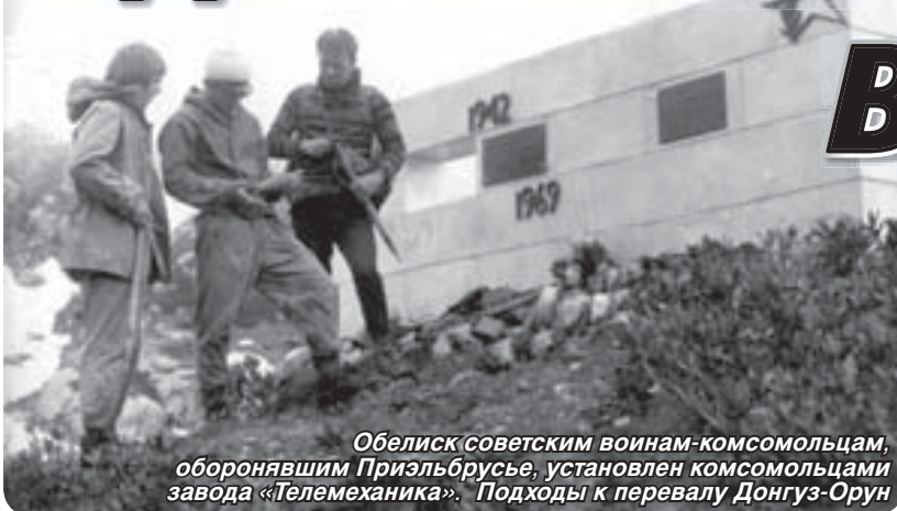
Обелиск советским воинам-комсомольцам, оборонявшим Приэльбрусье, установлен комсомольцами завода «Телемеханика». Подходы к перевалу Донгуз-Орун

– На перевале Эхо войны (3349 м) мы увидели блиндажи из березовых бревен, обшитых досками: они стояли совсем рядом с ледником, сползающим с Эльбруса, на высоте более трех тысяч метров над уровнем моря, – рассказывает ветеран труда. – Внутри были печи, сложенные из кирпича, стояли железные кровати, окна – из настоящего стекла. Обитатели блиндажей, а это были горные стрелки из дивизии «Эдельвейс», жили здесь с комфортом. Вокруг валялось множество гильз и патронов, снарядные ящики, разбитые радиостанции и даже неразорвавшиеся мины и снаряды. С перевала просматривалось все верховье Баксанского ущелья, откуда было легко контролировать любое движение войск и техники.