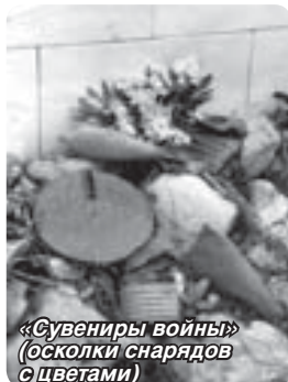
«Сувениры войны» (осколки снарядов с цветами)