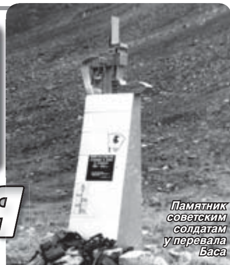
Памятник советским солдатам у перевала Баса