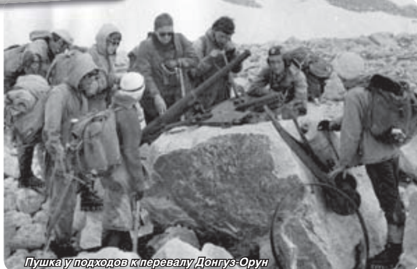
Пушка у подходов к перевалу Донгуз-Орун