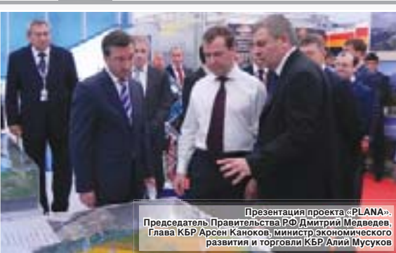
Презентация проекта «PLANA». Председатель Правительства РФ Дмитрий Медведев, Глава КБР Арсен Канокоев, министр экономического развития и торговли КБР Алий Мускуев

Первая в России в сфере агропромышленного производства особая экономическая зона создается в Майском районе Кабардино-Балкарии. Агроиндустриальный парк «PLANA» разместится в границах территории площадью 40 квадратных километров. Целью проекта – создание высокотехнологичного производства продуктов питания, способного конкурировать с крупнейшими мировыми производителями. По сути, это означает индустриализацию села, уникальные производственные комплексы и новые технологии общей стоимостью почти в 2 млрд. долл. США поставят крупнейшие в мире компании таких стран, как Швейцария, Германия, Япония, и др.