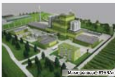
Макет завода «ETANA»

С учетом размещения единой технологической цепочки и в условиях реализации на территории льготного режима ОЭЗ себестоимость условной тонны товарной продукции, производимой на территории «PLANA» ($1720), вплотную приближается к рыночному показателю («benchmark») для китайского производства ($1700) и опережает показатель для стран – традиционных лидеров агропромышленного производства ЕС Евросоюза ($1945).