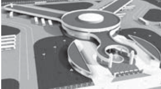
СТРОИТЕЛЬСТВО АВТОВОКЗАЛА (СЕВЕРНОЕ НАПРАВЛЕНИЕ)

Для всех, кто ежедневно приезжает из районов в Нальчик, очевидно, что автовокзал №2 (ул. Осетинская), хотя и стал за многие годы привычной частью центра города, но уже давно не отвечает уровню современных вокзалов и создает множество проблем. Он ежедневно принимает около двух тыс. единиц автотранспорта, что осложняет здесь дорожное движение.