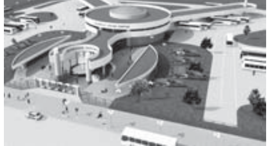
СТРОИТЕЛЬСТВО АВТОВОКЗАЛА (ЮЖНОЕ НАПРАВЛЕНИЕ)

Любое общение начинается с приветствия, а знакомство с городом с вокзала. И так же, как крепкое рукопожатие и радужная улыбка создают позитивный настрой на взаимопонимание, так и состояние автовокзалов отражается на отношении гостей к городу и его жителям.