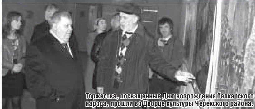
Торжества, посвященные Дню возрождения балкарского народа, прошли во Дворце культуры Черкесского района.

Праздничный день начался с автопробега, который стартовал с площади перед зданием райадминистрации с. Кашхатау. В нем приняли участие около 80 экипажей на автомобилях высокой проходимости из Кабардино-Балкарии, Северной Осетии, Ингушетии, Дагестана, Карачаево-Черкесии, Ставропольского края, Астрахани.