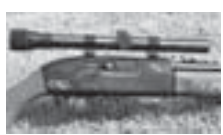
Бывший житель Ставропольского края, а ныне бомж, украл пневматическое ружье у жителя Баксана.

Видно, жизнь без определенного места жительства полна опасностей, и ее лучше вести с оружием в руках.