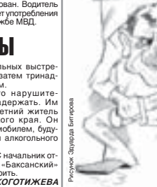
Рисunek: Эльмира Битирева

Напомним, что в конце марта полицейские задержали двоих грабителей аптеки на улице Аххова в Нальчике.