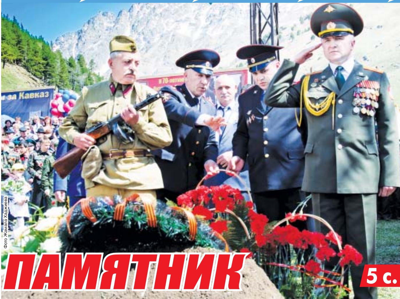
Фото Жамалы Хаджиева