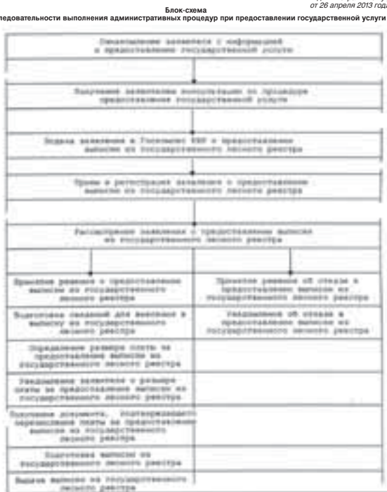
Приложение № 2 к Административному регламенту от 26 апреля 2013 года № 66-УГ

Приложение № 1 к Административному регламенту от 26 апреля 2013 года № 66-УГ