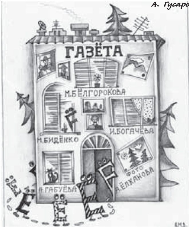
Рисунок Марины Биленко

Филолог, торжествуй! Буква «Ё», не плачь! Внимательный читатель заметил, что на страницах «КБП» обрела своё место седьмая буква русского алфавита, официально признанная в 1783 году, – такой подарок мы сделали себе к Дню филолога.