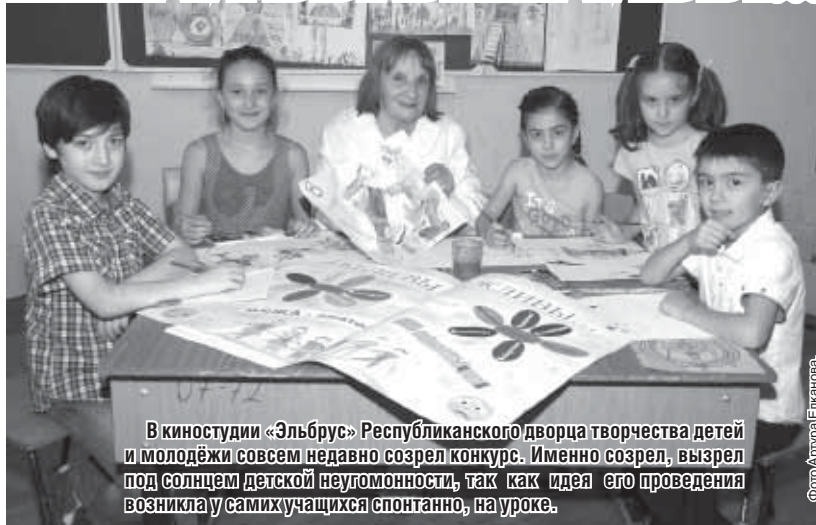
В киностудии «Эльбрус» Республиканского дворца творчества детей и молодёжи совсем недавно созрел конкурс. Именно созрел, вызрел под солнцем детской неутомимости, так как идея его проведения возникла у самих учащихся спонтанно, на уроке.