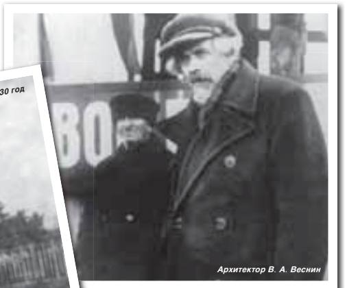
Архитектор В. А. Веснин

Но воплощённая в реальности архитектурная задумка вызвала недоумение у многих нальчан. Так, безымянный автор статьи «Заметки архитектора» («Социалистическая Кабардино-Балкария», 1935, 15 сентября) писал, что «возведённые постаменты с колоннами, несмотря на фонтан меж-ду ними, не производят цельной композиции и органического единства с окружением. Этот вход должен был замкнуть длинную перспективу центральной аллеи парка (если смотреть со стороны Долинска) и в то же время должен явиться оформленным местом преломления оси указанной аллеи, которая под углом продолжалась далее между гостиницей, Ленгучгородком (Ленинским учебным городком, в котором располагается медицинский факультет КБГУ — авт.) и обрамлена сплошной стеной влочек. Если посмотреть из этой аллеи на выход, то видишь только одну правую часть его, которая занимает совершенно случайное место в перспективе и никак не подготавливает зрителя к новому окружению — парку с широкими аллеями, цветами и так далее. И даже когда вы совсем подошли к парку, разорванная на сантиметры части калькуляция ощущения входа в новое пространство не создаёт». Вероятно, эта критика была в чём-то справедливой, но годы показали — архитектурное решение было закономерным и аргументированным. Правда, со временем ликвидировали фонтан, располагавшийся в тридцатых годах практически сразу за входом — он не только мешал движению отдыхающих, но и «скрады-