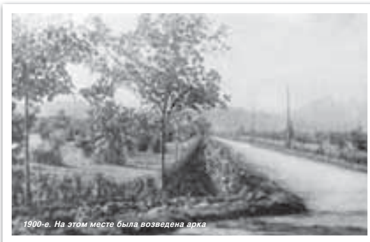
1900-е. На этом месте была возведена арка

В нашей книге «Неповторимый Нальчик» есть раздел «Поэтическое слово», который включает в себя стихи литераторов о столице Кабардино-Балкарии. Вошло в него и стихотворение выдающейся кабардинской поэтессы Инны Кашежовой «В Нальчикском парке» с такими пронзительными строками: «Не изменилось ничего здесь в парке, / лишь скамьи шире стали да старей дубы... / О, как вы, старые, большие парки, / к жизни воспоминаниям добры!». У каждого из нас, конечно, свои воспоминания о парке, о любимых местах в нём, знакомых объектах. Одним из последних является вход в парк с постаментами, внизу которых расположены львиные морды, извергающие воду. В начале 1923 года со-