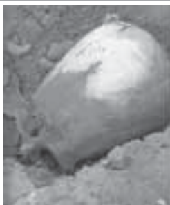
Удлиненный череп, найденный у селения Кенделен. 2012 г.