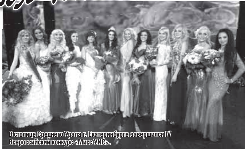
В столице Среднего Урала г. Екатеринбурге завершился IV Всероссийский конкурс «Мисс УИС».