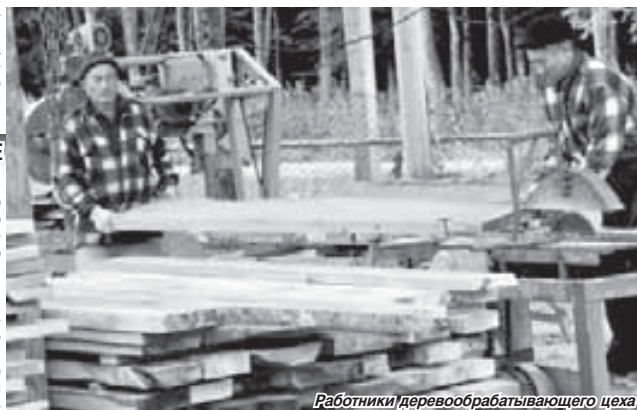
Работники деревообрабатывающего цеха

села будут вовлечены в процесс строительства объектов, обслуживания гостей, получат дополнительные возможности для сбыта сельхозпродукции. У нас есть два выпускника КБГУ, окончивших отделение сервиса и туризма, готовых приступить к работе по специальности.