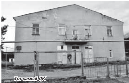
Тот самый ДК