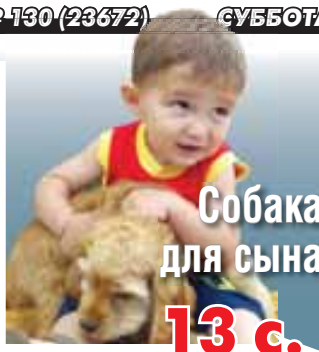
Собака для сына 13 с.