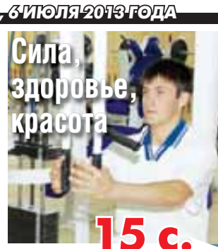
Сила, здоровье, красота 15 с.