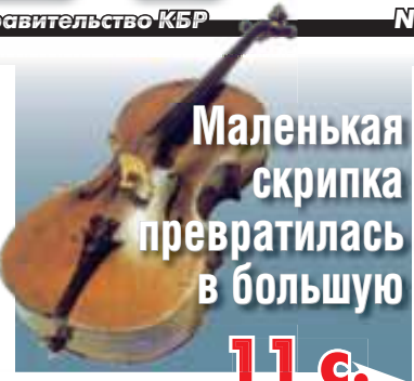
Маленькая скрипка превратилась в большую 11 с.