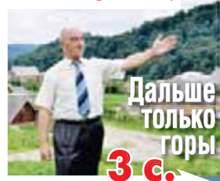
Дальше только горы 3 с.