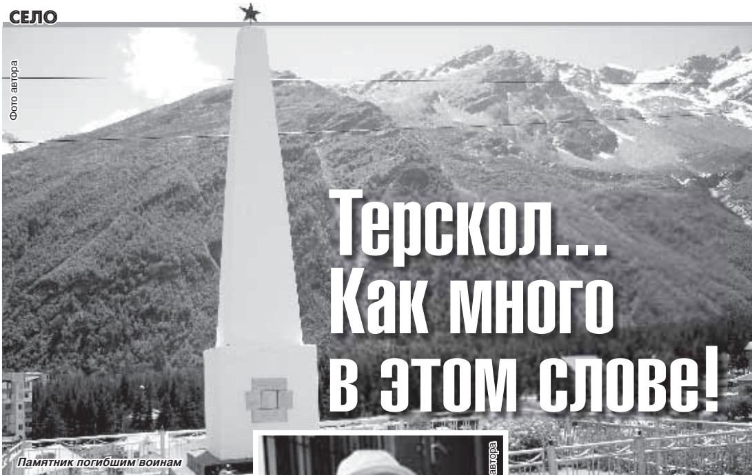
Памятник погибшим воинам