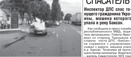
По данным ГИБДД водитель является злостным нарушителем правил: с января 2012 года он допустил 25 нарушений, из которых восемь – превышение установленной скорости.

13 июля в 18 часов 20 минут в Нальчике на ул. Кабардинская водитель автомобиля ВАЗ-2106 выполнял маневр разворота, не убедившись в его безопасности. Произошло столкновение с автомобилем «BMW X5», в результате удара ВАЗ-2106 перевернулся, и 57-летний водитель погиб на месте. В этот же день в 20 часов 5 минут в Нальчике на ул. Мальбахова автомобиль ВАЗ-21093 сбил пешехода, который переехал проезжую часть дороги вне зоны действия знака «Пешеходный переход». Мужчина 1956 года рождения от полученных травм скончался на месте. Сотрудники ГИБДД предполагают, что ДТП произошло вследствие неправильного выбора скорости водителем и нарушения порядка проезжей части пешеходом.