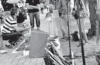
Сериал «Моя большая армянская свадьба»

Музыкальные диски дорогие (200 рублей). Но полностью можно слушать и по радио. Если вы не любите музыку даром. Ну, или почти даром: где вы видели уличного музыканта, перед которым не лежат бы раскрытый футляр и инструменты, шляпа или протая коробка?