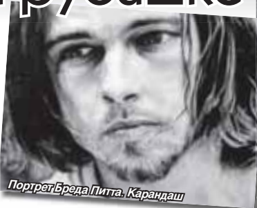
Портрет Брэда Питта. Карандаш