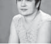
Владимир Высоцкий считал, что «лучше гор могут быть только горы, на которых ещё не бывал». Для чегоного-географа лучше книг могут быть только книги?

«Не только книги. Проводить время в горах тоже замечательно. А ещё люблю своих студентов, заражаясь от них энергией и молодостью. Но в принципе вы правы. Исследование будет продолжено, ведь история альпинизма, как и ваша газета, пишется ежедневно. Всем, кто располагает какой-либо информацией и документами об альпинизме и захочет связаться со мной, могу сообщить адрес своей электронной почты: loga-0708@mail.ru. Будем вместе писать историю альпинизма и горнолыжного спорта в нашей республике и в целом географии».