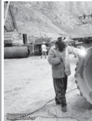
Выполняются сварочные работы

(Окончание. Начало на 1-й с.) Строительству сегодня объект считается сложным. В середине лета Баксан становится пологим и бурным, рывть котлованы под опоры сложно. К тому же попадаются большие валуны, большие породы, и требуется выполнить немалый объем буровых работ. Тем не менее дело продвигается. Согласно проекту длина моста, с учетом всех трех пролетов, составит около ста метров. На подводных путях будет занята рабочая зона в связи с монтажными одна из субподрядных организаций г. Нальчика.