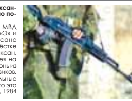
Материалы рубрики подготовил Азрет КУЛИЕВ

В пресс-службе республиканского МВД сообщают, что полицейские из центра «Эн и сотрудники УФССБ, проводившие розыск членов бандподполья, на перекрестке улиц Катханова - Ленина, что на въезде в Баксан, попытались остановить жителя Дугулубгея на автомобиле «ВАЗ-Приора». Тот открыл огонь из пистолета в ответ на сигналы сотрудников. Нападавший не остановился. Его персональные данные не сообщаются, известно лишь, что это нигде не работавший житель Дугулубгея, 1984 года рождения.