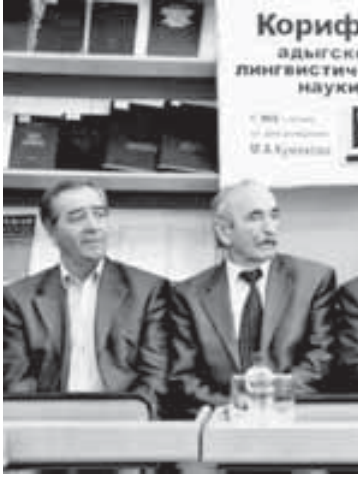
Корифей адыгской лингвистической науки