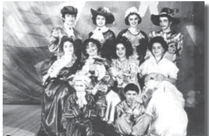
Члены литературно-художественного кружка