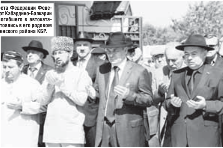
(Окончание на 2-й с.)

Выступая на траурном митинге, Глава КБР Адам Каноков отметил, что ему очень трудно говорить о своём друге и коллеге в прошедшем времени.