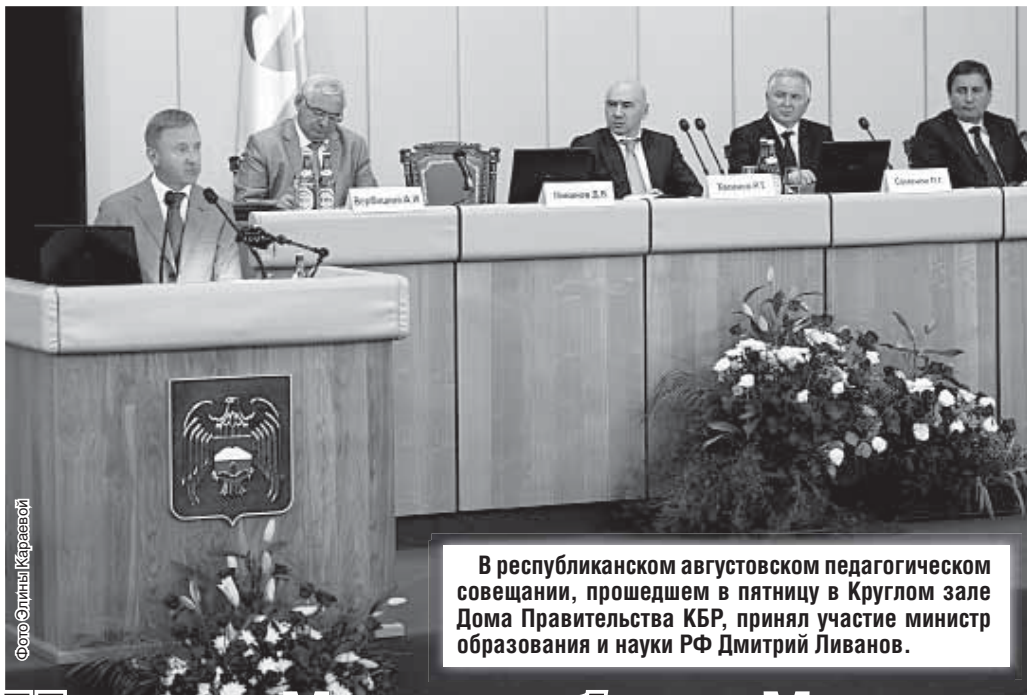
В республиканском августовском педагогическом совещании, прошедшем в пятницу в Круглом зале Дома Правительства КБР, принял участие министр образования и науки РФ Дмитрий Ливанов.