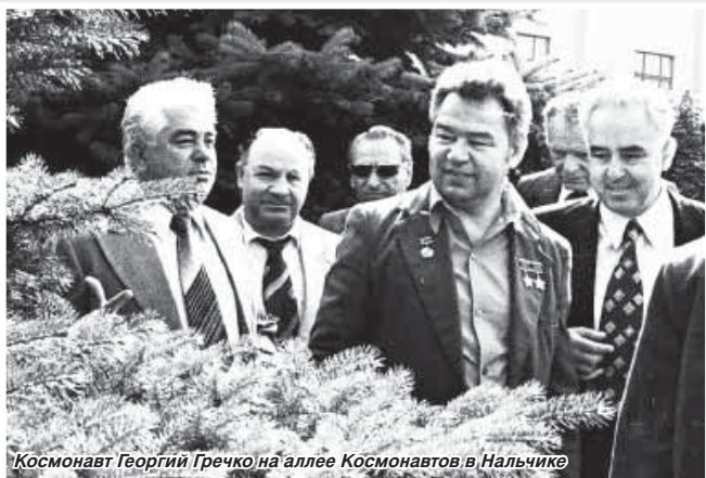
Космонавт Георгий Гречко на аллее Космонавтов в Нальчике

* В начале периода продолжалось техническое оснащение промышленного комплекса, велось крупное строительство, увеличивались капитальные вложения, повысилась фондовооружённость и электровооружённость труда. В структуре