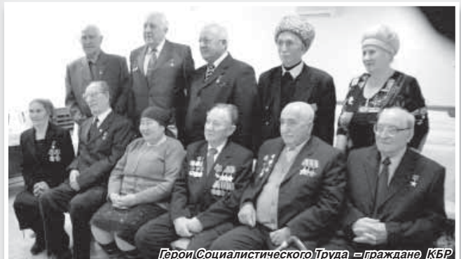
Герои Социалистического Труда – граждане КБР

* Обустроено почти две тысячи километров дорог: из Нальчика в Пятигорск, Орджоникидзе, Прохладный, Моздок, в ущелья Балкарии.