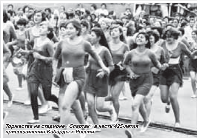
Торжества на стадионе «Спартак» в честь 425-летия присоединения Кабарды к России