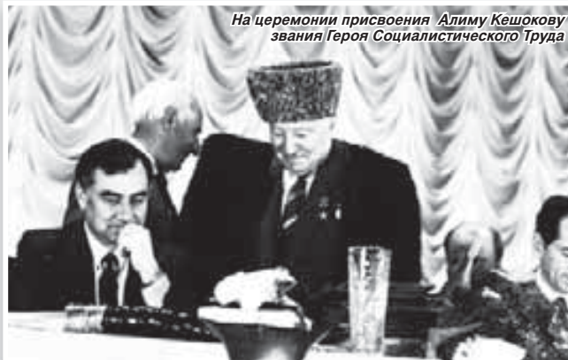
На церемонии присвоения Алимю Кешокову звания Героя Социалистического Труда

практически во всех отраслях, не обеспечивается нормальный процесс воспроизводства, темпы экономического роста имеют отрицательное значение. Причина такого положения в сломе прежней системы управления, распаде единого союзного государства и переходе к новой социально-экономической системе, основанной на сосуществовании различных форм собственности и хозяйствования.