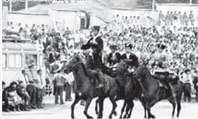
Торжества на стадионе «Спартак» в честь 425-летия присоединения Кабарды к России