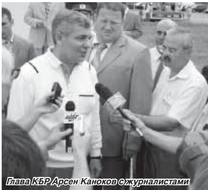
Глава КБР Арсен Каноков с журналистами

(колхозники стали получать паспорта лишь во времена «хрущёвской оттепели», в конце 1950-х гг.).