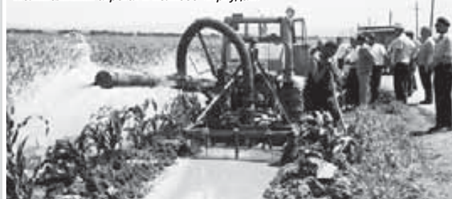
Поливальный агрегат в колхозе «Аргудан»

сфере трудятся порядка 95 тыс. человек, или 30% от общего числа занятых в экономике. Доля малого бизнеса в формировании ВРП составляет 27%.