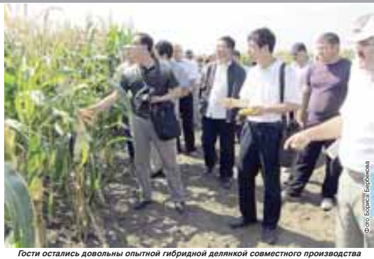
Гости остались довольны опытной гибридной делянкой совместного производства

Нынешнему Дню российского поля в КБР предшествовала Международная научно-практическая конференция в Нальчике с участием представителей 24 регионов России, стран дальнего и ближнего зарубежья, – пояснил А. Маремуков. – Идея проведения агрофорума, которая была реализована под патронажем Россельхозакадемии и республиканского Правительства, инициировал наш институт. На ней предметом дискуссии стали проблемы и перспективы развития аграрного сектора экономики Северо-Кавказского федерального округа. (Окончание на 2-й с.)