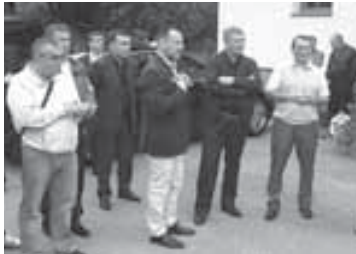
В долине Venosta. Итальянцы рассказывают о своём производстве.

(Окончание. Начало на 1-й с.) Гостю пояснили, что абрикосы здесь хранят до 3-4 дней, а вот яблоки могут пролежать до 10 месяцев. Затем итальянцы пригласили посетить живописную долину Venosta, где сохранилось знакомство с новыми технологиями посадки садов на высоте от 800 до 1200 м, а также новыми методами культивации, обрезки