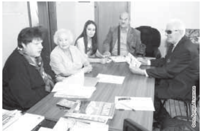
Союз Журналистов КБР