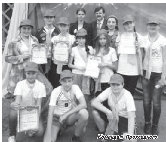
Команда г. Прохладного

Сама эстафета состояла из десяти этапов – краеведческого, этнографического, литературного, творческого, экскурсионного, ботанико-зоологического, спортивно-игрового, а также этапов «Зелёная аптека», «Юный журналист. Проба пера» и конкурса эмблем.