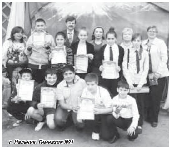
г. Нальчик. Гимназия №1

Во время торжественного открытия каждая команда представила себя, причём требование к презентации было одно – в любой интересной форме.