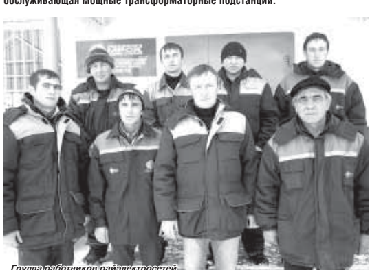
Группа работников райэлектросети

Воздушные и кабельные линии электропередачи в Эльбурском районе протянулись на 375 километров. Районные электросети обслуживают, кроме того, 115 трансформаторных подстанций. Для оперативности территория разбита на сетевые участки. Тырныузский охватывает весь город, Былымский – Былым, Бедьки, Лашкуту, Кёнделем, терскольский – все населённые пункты и туристические объекты, расположенные выше Тырныуза. Образована также группа, обслуживающая мощные трансформаторные подстанции.