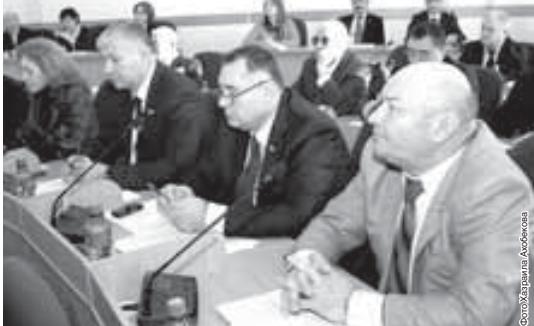
Минздрава республики, что позволит снять болевые точки по лекарственному обеспечению.

Кроме того, президент комитета рассказал, что 232 миллиона рублей планируется зарезервировать в бюджете