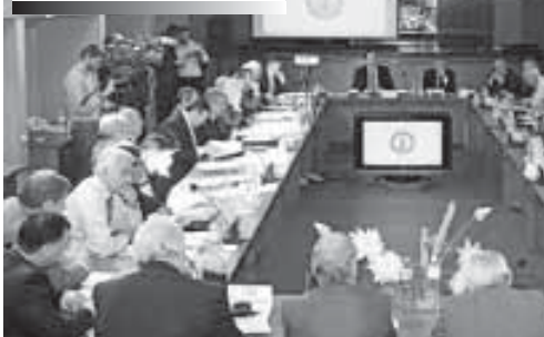
Полная версия «Адыгэ псалъэ»

ДАХ-м и Хасащэхэм и зи чэзу зэлүшцэр шцэбэт кIуам Налшык къалэ шцекIуэкIащ. Абы хэтэц Тыркум, Сирием, Иорданием, Германием, США-м, Адыгейм, КъШР-м, Краснодар крайм, Мэздгугу шциналъэхэм шцтэу ди лэпкъгъэхуэм я лыкIуэхэр.