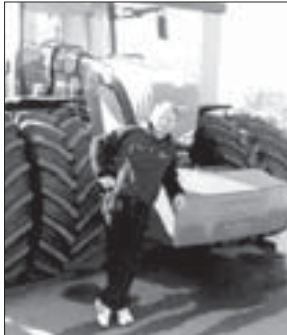
Уцэрэфжажэр кьушлэцкэ?! Шалэр ахэм егупсысу и нэхэр шхьэмьжэмм топлызы...

Гуэдэ шхьэмьжэмм кьыхокыжри, помидорхэмкэ еунэтл. Мыхэри хуабжэу бэгуаш. Клуэдактым Залым и пцлэнтлэпсыр. Илэс 15 хуауэ шым толжыкы, абы и палы фыуэ кышлэц. Арац, лажэм лэжэ ешх, жыхуафэри.