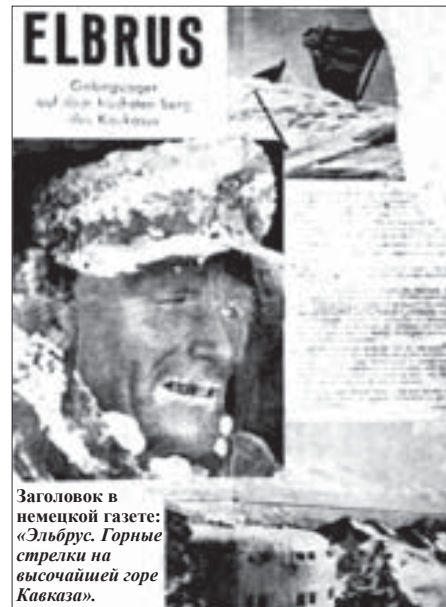
Заголовок в немецкой газете: «Эльбрус. Горные стрелки на высочайшей горе Кавказа».