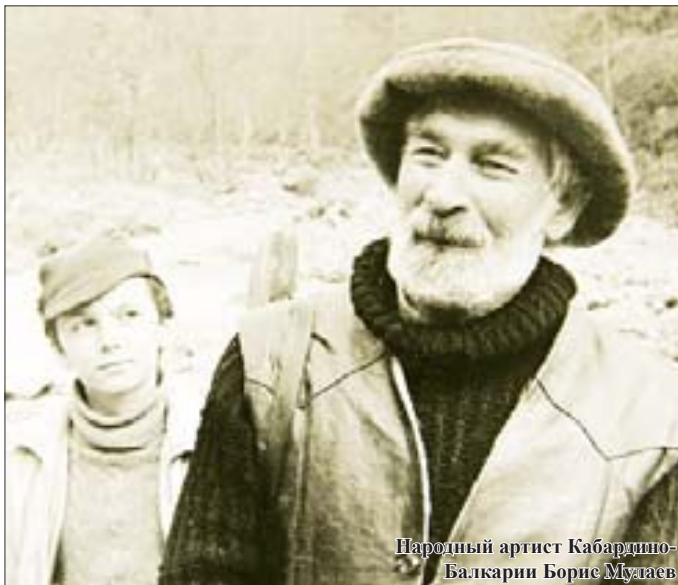
Народный артист Кабардино-Балкарии Борис Музаев