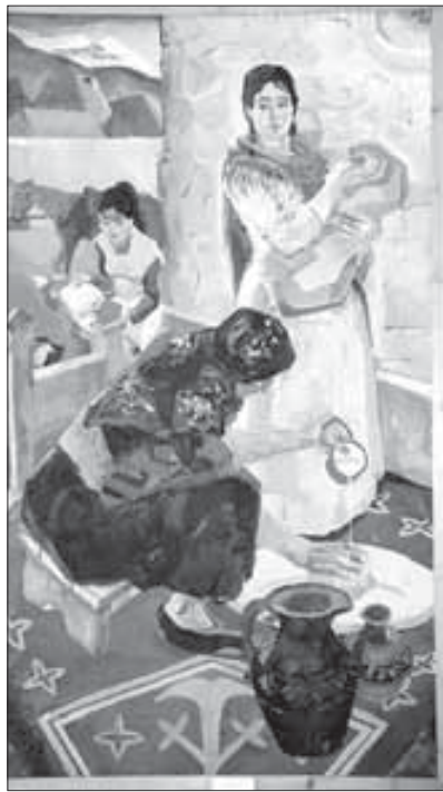
«В родном ауле», 1971 г.

В соответствии с Указом главы КБР от 1 августа 2013 года 8 августа 2013 года объявлено нерабочим днем по случаю праздника Ураза-Байрам.