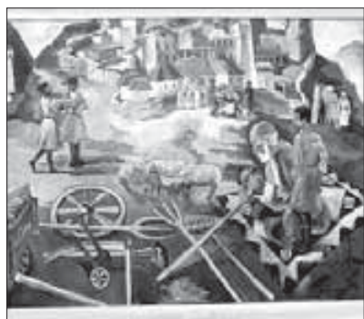
«Завтра – летняя страда», 1988 г.