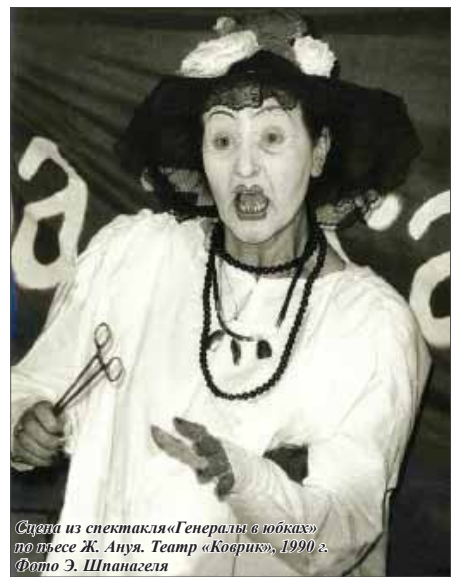
Сцена из спектакля «Генералы в юбках» по пьесе Ж. Анж. Театр «Коврик», 1990 г.

С «Ковриком» же связан случай, который ей больно вспоминать до сих пор. «Каждый актер хочет играть, хочет быть на виду, хочет, чтобы о его ролях говорили. Мы должны знать: вот я сейчас тебе выложу частицу своего сердца – и ты, зритель, пусти ее к себе в сердце и покажи мне, что впустил, я должна это знать. Играли «Звезды на утреннем небе», у меня ключевой монолог, трагический, страшный, а тут в шаге от меня – «Коврик» ведь был очень маленький театр – в первом ряду сидят три девочки и – смеются! Я доиграла спектакль не знаю как. Как мне было обидно, как больно! Я настолько сейчас перед вами все, что мне богом дано, всю свою душу, свой мозг, каждую частицу своего тела – выложила, а вы – смеетесь! Думала, что больше вообще не буду играть – Казбек с трудом переубедил меня».