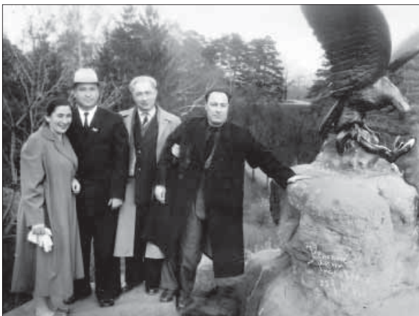
Унутмаганна адамла, кеп жыл шухьлук жюрюутгенле былай туренин кьаллыкдыла деп.