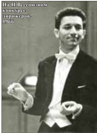
На II Всесоюзном конкурсе дирижеров. 1966