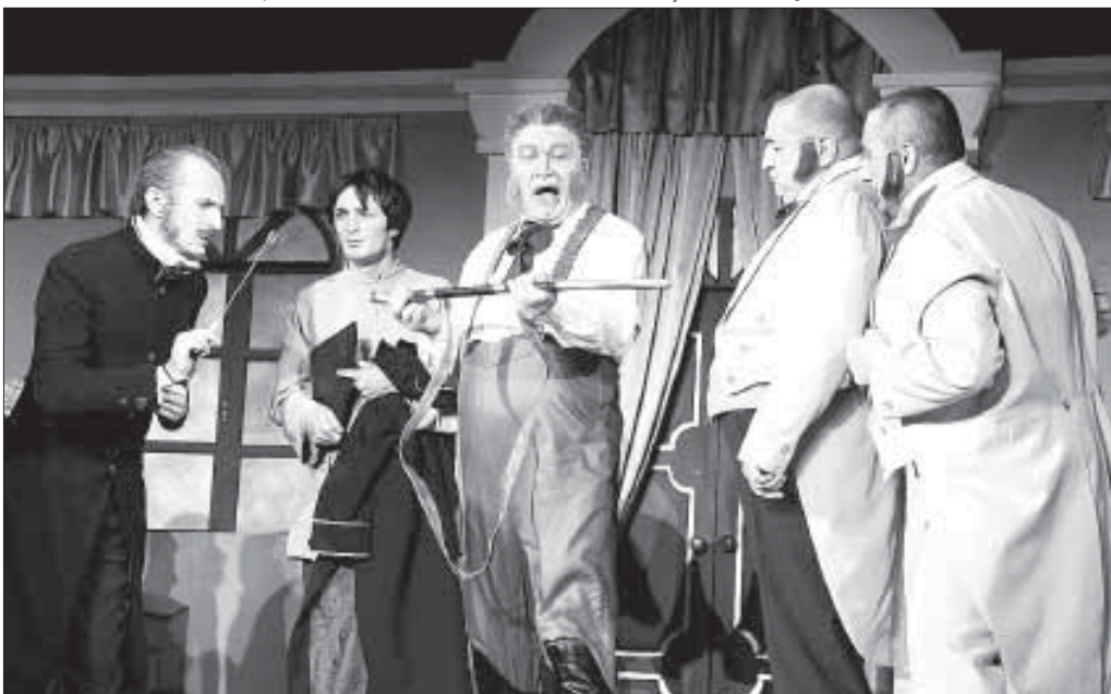
Фото (и видео на сайте www.smkbr.net/ ) видео) Евсения Каюдина .