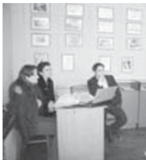
Убашалы Оатима ишини кыруулаганы кезинде.

«СИГМА» илму биринги кууралганлы жыйырма жылдан артык болады. Аны төбегинде биринги хунерли шакчулуну саны да көбөйдү-көп болуп барды. Анга бу көнлөдө бардырган илму-практика конференция да шагытлык этеди. Быйыл анга 400-ден аслам иш хазырланганды. Аладан бек илгери Битеуросск конгрессла эм конференциялагы айырлыккыды.